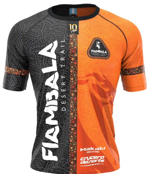
Remera oficial 2025 by makalu

producto incluido en el kit (incluido en todas las carreras)