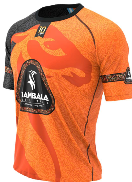
Remera expo 2025 by makalu

producto incluido en el kit (incluido en todas las carreras)